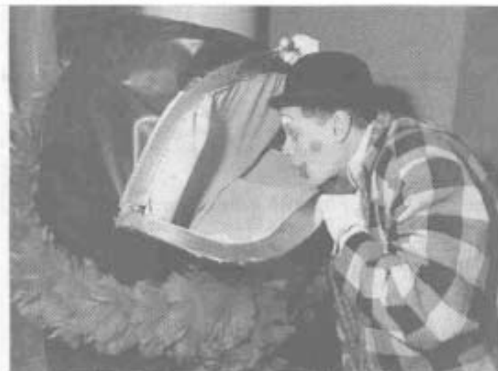
Große Klappe: Ein Clown sucht nach Einsichten. Oder nach Tombola-Losen, die weggingen wie warme Semmeln.